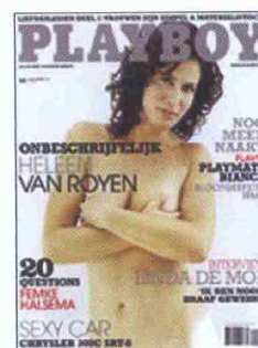
Qui sopra: la scrittrice olandese Heleen van Royen su una copertina di Playboy del 2006 e, più in alto, in una foto da bambina.